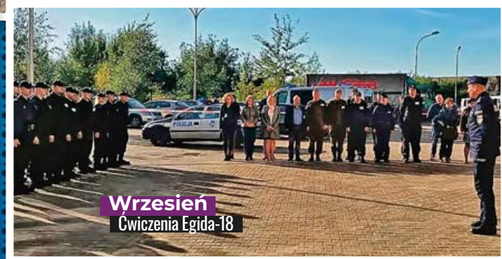
Wrzesień Cwiczenia Egida-18