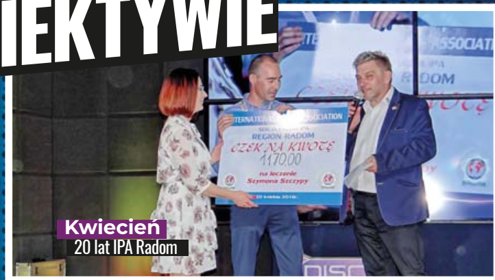
Kwiecień 20 lat IPA Radom