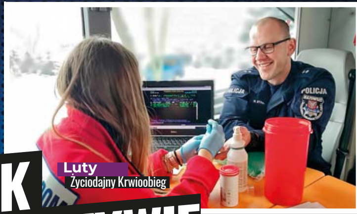
Luty Zyciodajny Krwioobieg