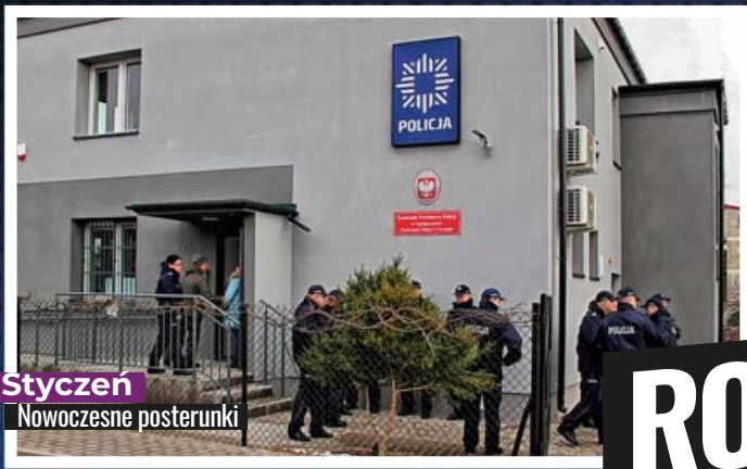
Styczeń Nowoczesne posterunki