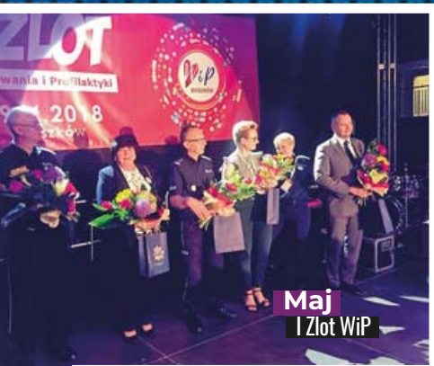
Maj I Złot WiP