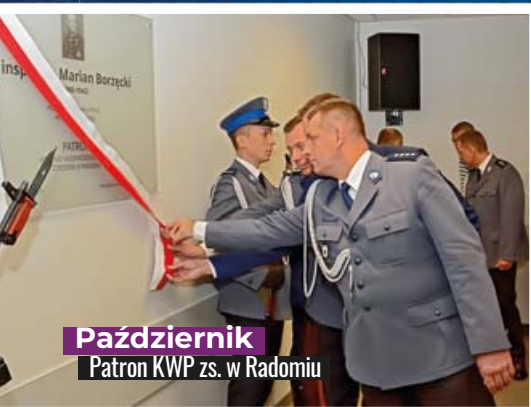
Październik Patron KWP zs. w Radomiu