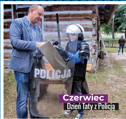
Czerwiec Dzień Taty z Policją