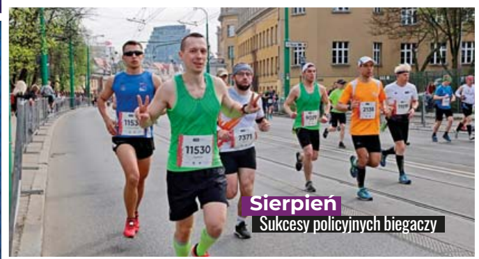
Sierpień Sukcesy policyjnych biegaczy