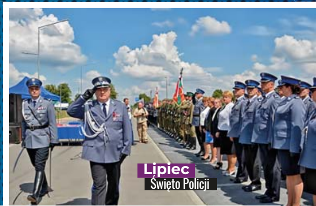
Lipiec Święto Policji