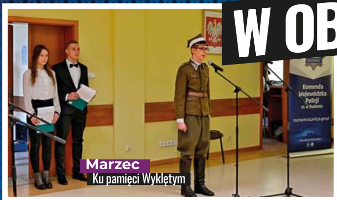
Marzec Ku pamięci Wykłym