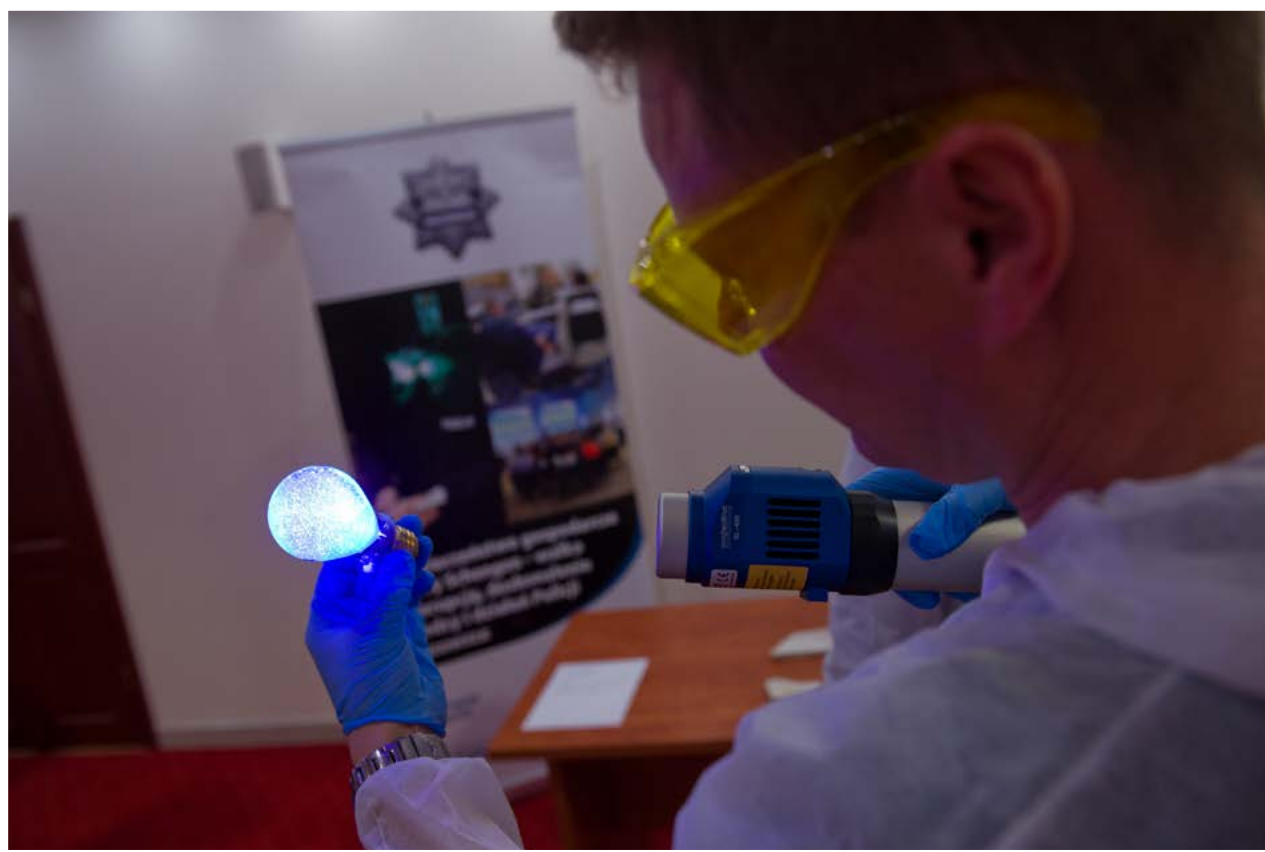
Szkolenie dla techników kryminalistyki