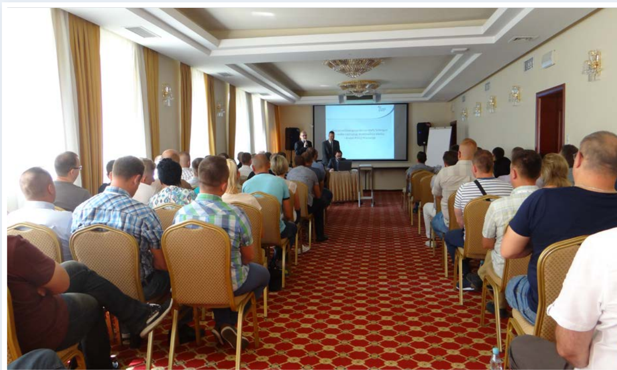
Szkolenia regionalne dla służb dochodzeniowo-śledczych

Wydział Dochodzeniowo-Śledczy Komendy Wojewódzkiej Policji zs. w Radomiu prowadzi postępowania przygotowawcze w sprawach o najpoważniejsze przestępstwa kryminalne. Są to sprawy przeciwko życiu, zdrowiu, mieniu, przestępczości narkotykowej i cyberprzestępczości. W Wydziale prowadzone są także sprawy o przestępstwa z nienawiści. Ponadto WDŚ KWP zs. w Radomiu sprawuje zwierzchni nadzór nad pracą procesową w komendach miejskich i powiatowych garnizonu mazowieckiego. Z perspektywy sprawowanego nadzoru widoczna jest duża fluktuacja kadry procesowej. Coraz więcej spraw prowadzonych jest przez funkcjonariuszy z niewielkim stażem w „dochodzeniówce”. Ponadto z latami rozwinęła się przestępczość internetowa – można powiedzieć, że to plaga dzisiejszych czasów. Pojawiły się nowe przestępstwa – np. stalking. Na dużą skalę rozwinęła się przestępczość gospodarcza, oszustwa skarbowe czy przestępstwa korupcyjne. Związane jest to m.in. z wejściem Polski do Unii Europejskiej i możliwością korzystania z wszelkiego rodzaju dopłat i dotacji. Dlatego