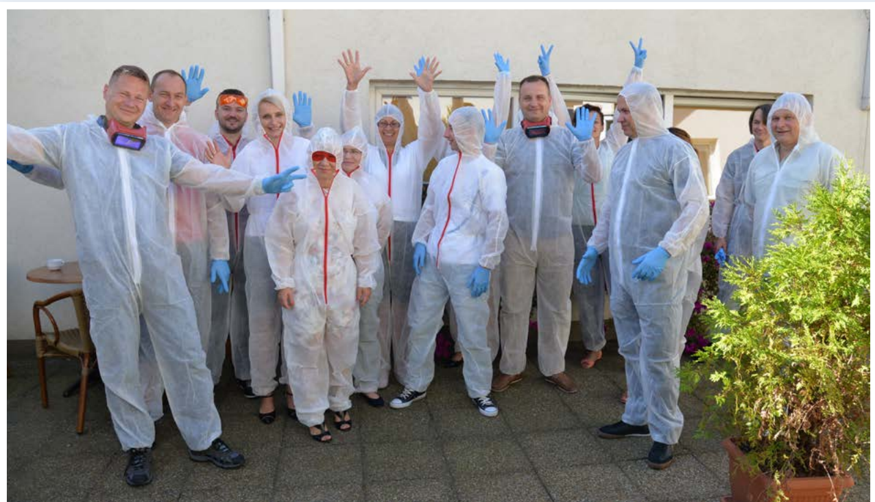
Szkolenie dla techników kryminalistyki