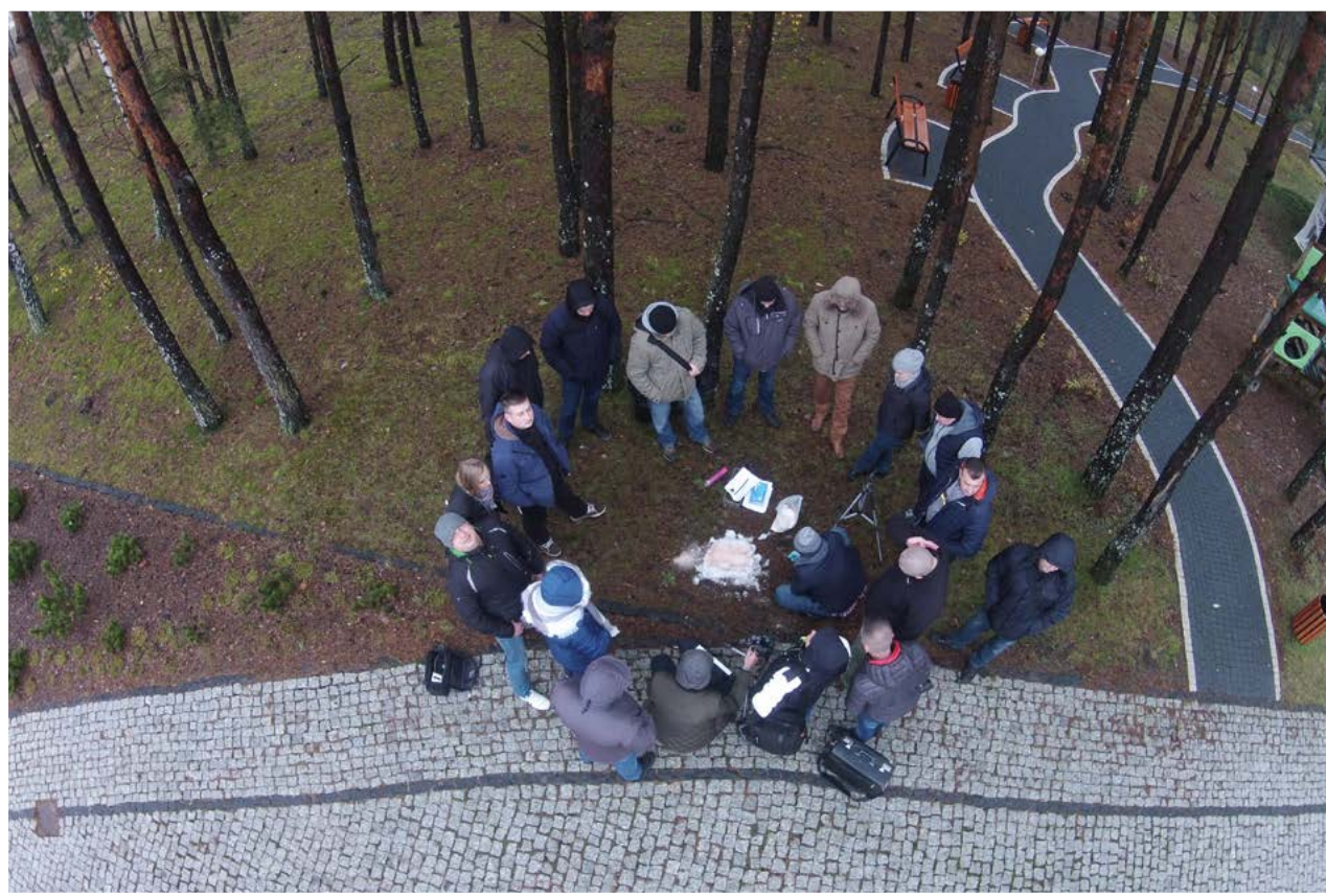
Szkolenie dla techników kryminalistyki

Uzyskanie odpowiedzi na powyższe pytania jest uwarunkowane: przebiegiem i wynikami oględzin, uzyskanymi wcześniej informacjami o zdarzeniu, wynikami innych czynności przeprowadzonych w trakcie śledczego (kryminalistycznego) badania miejsca zdarzenia, wiedzą oraz doświadczeniem zawodowym policjantów obsługujących zdarzenie.