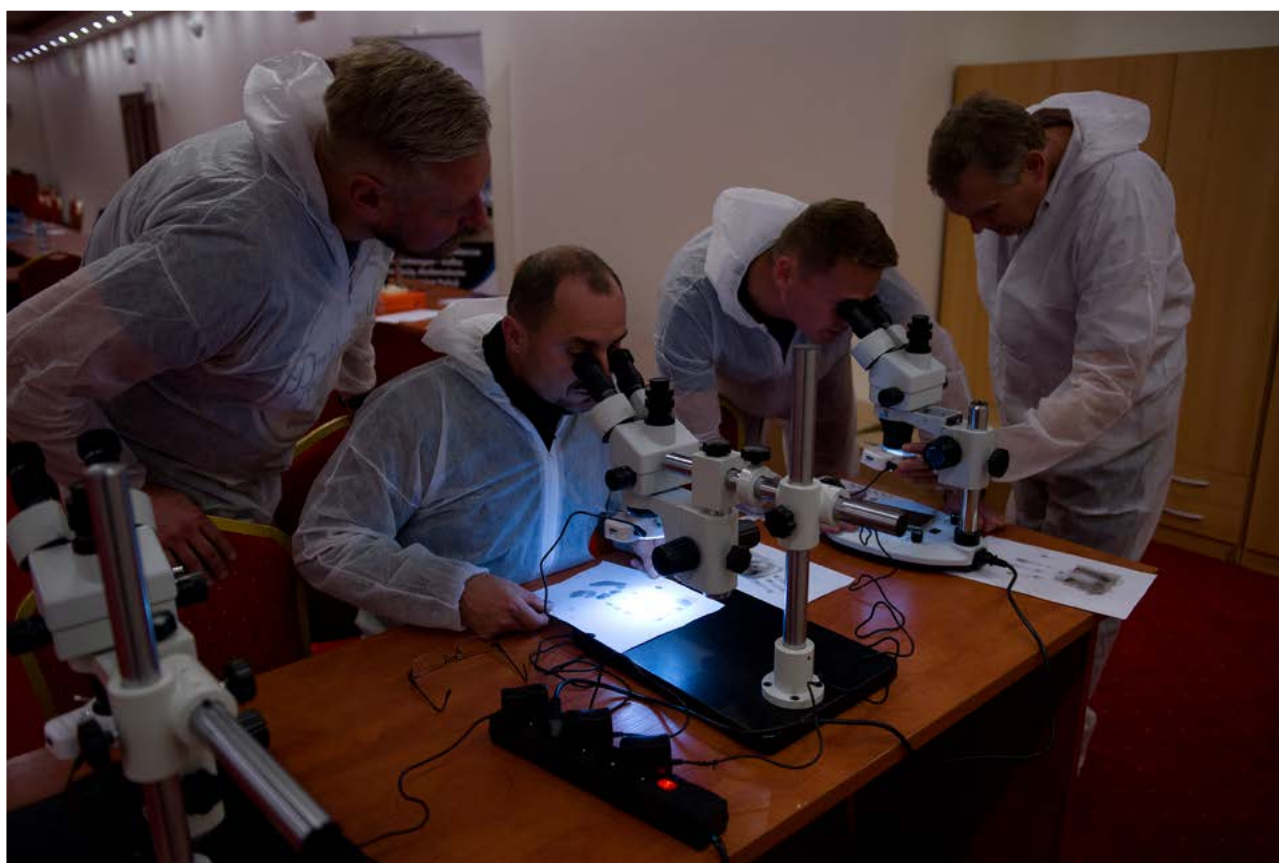
Szkolenie dla techników kryminalistyki