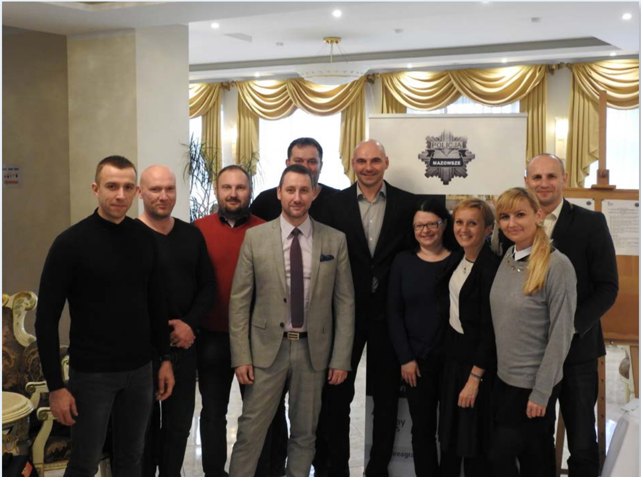
Seminarium dla służb operacyjnych

Na przestrzeni lat, powstawały różne definicje korupcji, często ewoluujące wraz z pojawianiem się nowych obszarów zagrożonych tym zjawiskiem.