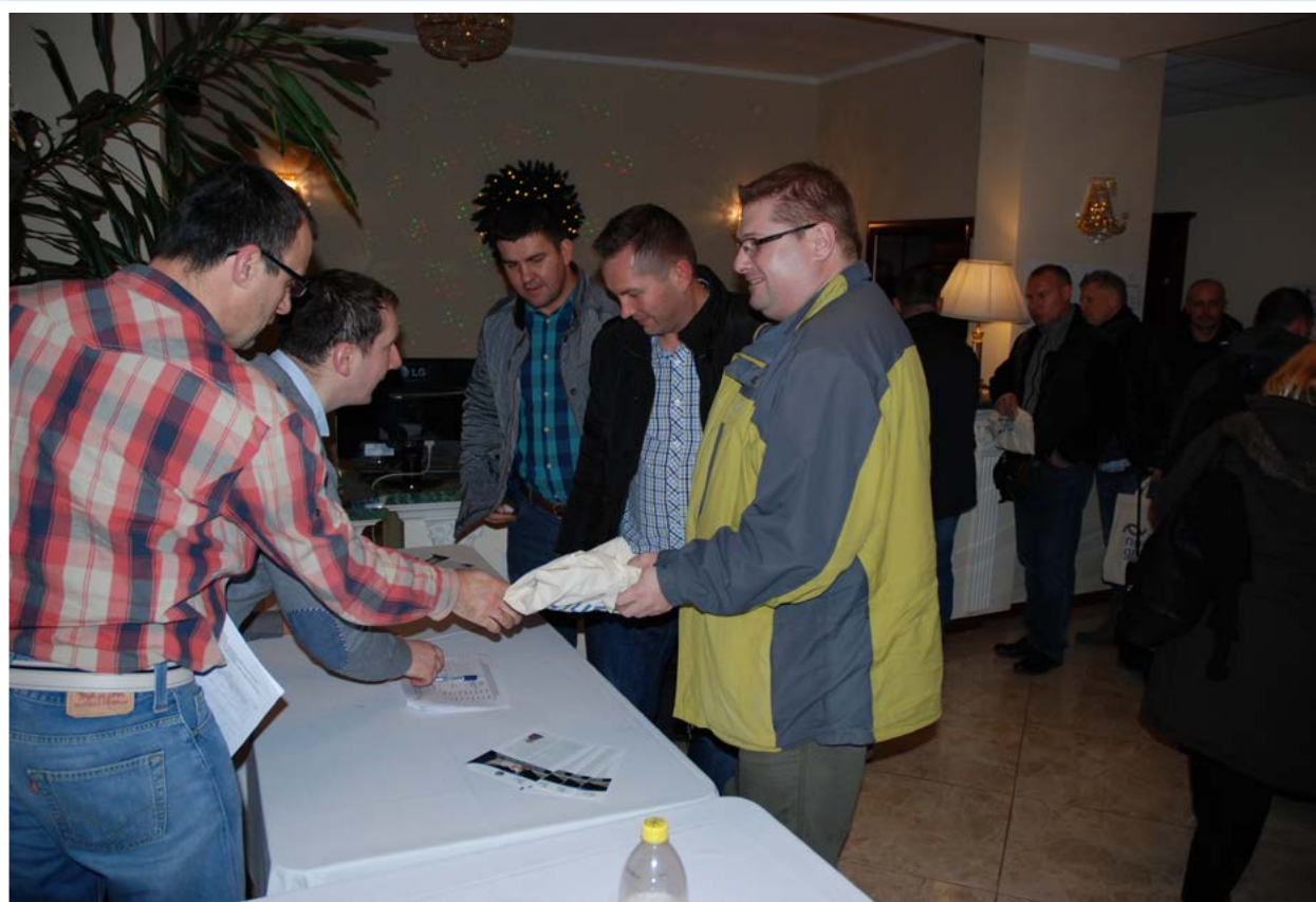
Seminarium dla służb operacyjnych

Kontrola operacyjna to kontrolowanie treści korespondencji, kontrolowanie zawartości przesyłek, stosowanie środków technicznych umożliwiających uzyskiwanie w sposób niejawni informacji i dowodów oraz ich utrwalanie – w szczególności obrazu, treści rozmów telefonicznych i innych informacji przekazywanych przy pomocy sieci telekomunikacyjnych.