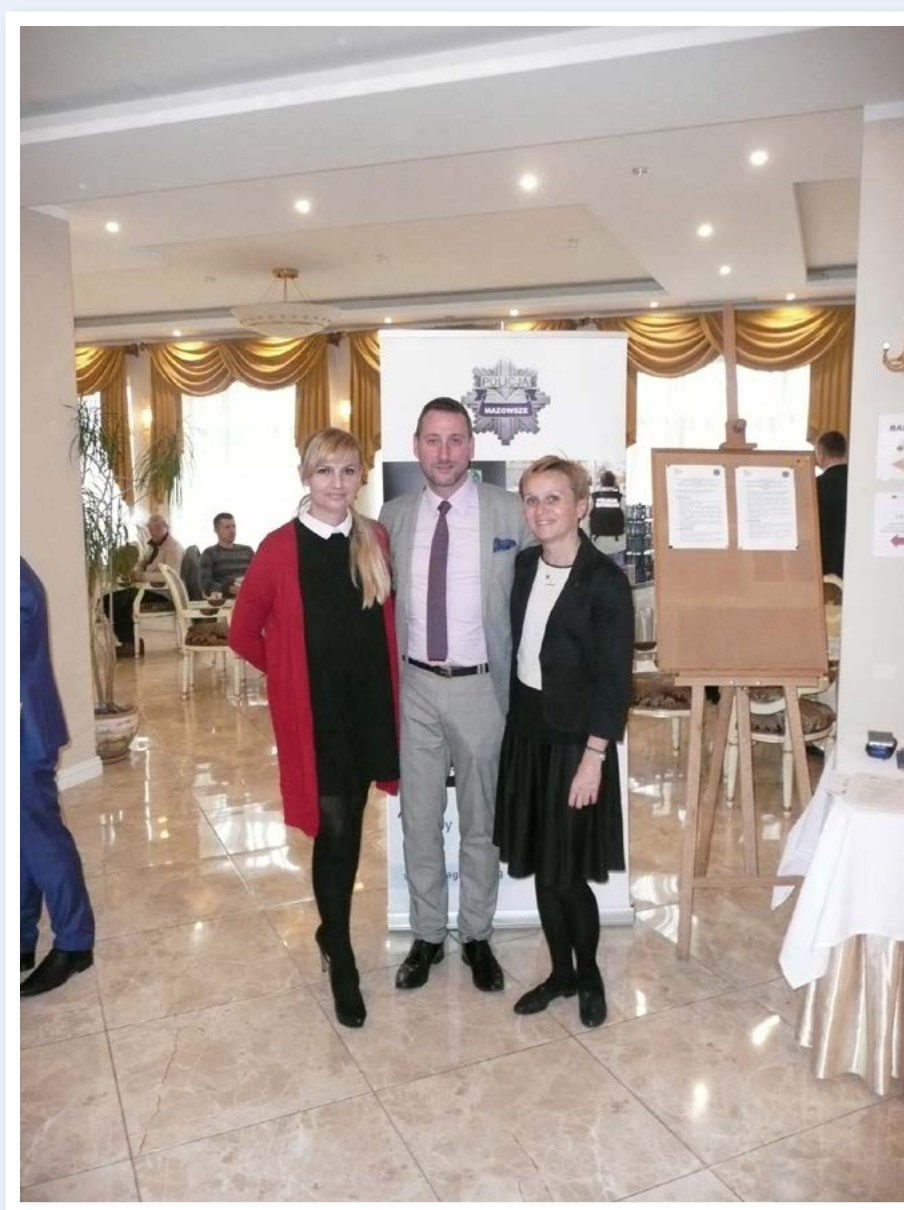
Seminarium dla służb operacyjnych

Powyższe informacje stanowią zaledwie pewien ułamek wiedzy jaką mieliśmy okazje pozyskać podczas wystąpień przedstawicieli ww. instytucji. Z uwagi na obszerność materiału w niniejszej publikacji postanowiono tylko zasygnalizować pewne kwestie, natomiast szerzej na temat korupcji możemy przeczytać na stronach internetowych KWP zs. w Radomiu, gdzie znajdują się prezentacje przedstawicieli poszczególnych instytucji, w których mamy okazje poznać ich zadania, kompetencje, a przede wszystkim możliwość wykorzystania ich potencjału w walce z przestępczością korupcyjną.