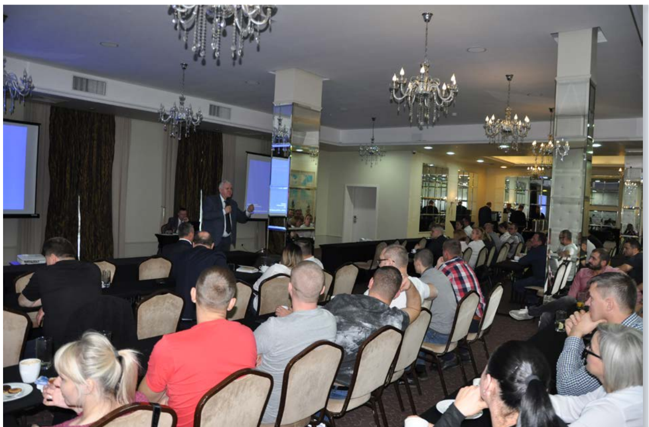
Szkolenia regionalne dla służb dochodzeniowo-śledczych

Po zakończonych wystąpieniach uczestnicy zgodnie twierdzili, że wiedza jaka została im przekazana będzie przydatna w dalszej pracy. Z pewnością udział w szkoleniach spowodował poszerzenie wiedzy policjantów, którzy brali w nich udział. Nie bez znaczenia pozostaje też fakt nawiązania kontaktów przez policjantów z KMP/KPP garnizonu mazowieckiego z funkcjonariuszami KWP zs. w Radomiu czy też KGP. W razie problemów z jakimś zagadnieniem z pewnością będą mieli możliwość zwrócić się z pytaniem do policjantów z jednostki nadrzędnej. Aby nie zostawać w tyle za przestępcami policjanci muszą podnosić swoje kwalifikacje i przeprowadzony cykl szkoleń z pewnością przyczynił się do poprawy jakości ich pracy. Każdy uczestnik szkolenia po jego zakończeniu otrzymał certyfikat.