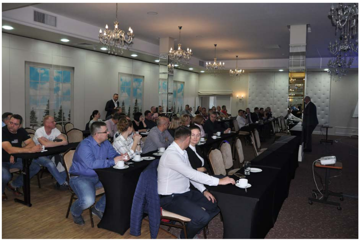
Szkolenia regionalne dla służb dochodzeniowo-śledczych