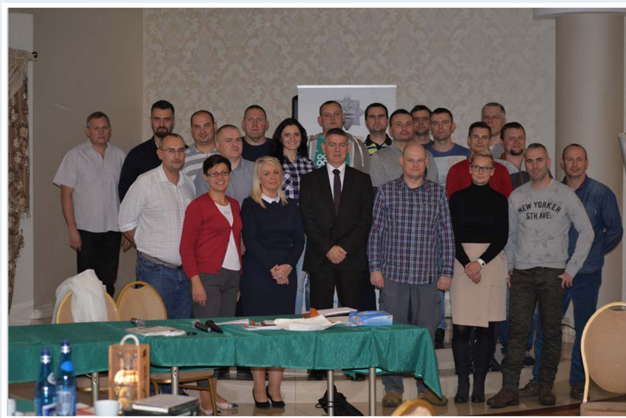
Szkolenie dla techników kryminalistyki