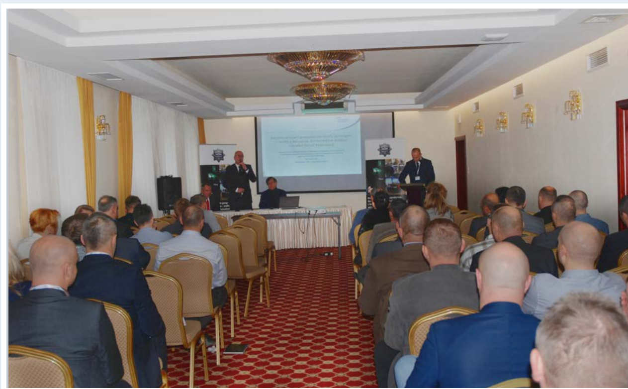
Seminarium dla służb operacyjnych

izby skarbowe, urzędy skarbowe, inspektorzy kontroli skarbowej, dyrektorzy okręgowych urzędów górniczych i specjalistycznych urzędów górniczych, dyrektorzy okręgowych urzędów miar i naczelnicy obwodowych urzędów miar, dyrektorzy okręgowych urzędów probierczych i naczelnicy obwodowych okręgów probierczych, dyrektorzy regionalnych zarządów gospodarki wodnej, dyrektorzy izb celnych i naczelnicy urzędów celnych, dyrektorzy urzędów morskich, dyrektorzy urzędów statystycznych, dyrektorzy urzędów żeglugi śródlądowej, komendanci oddziałów straży granicznej, komendanci strażnic oraz komendanci placówek kontrolnych i dywizjonów straży granicznej, okręgowi inspektorzy rybołówstwa morskiego, państwowi inspektorzy sanitarni, powiatowi lekarze weterynarii.