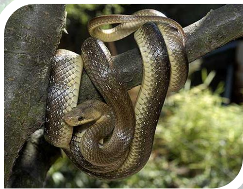
ESKULAPA - Gatunek objęty ścisłą ochroną.