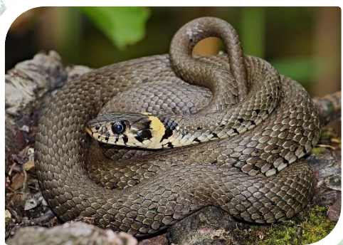
ZASKRONIEC – Charakterystyczne cechy: żółte plamy na obu skroniach tuż za głową. Gatunek chroniony