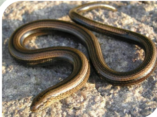
PADALEC – JASZCZURKA. Gatunek chroniony

Żmije występują na terenie całej Polski. Ciało żmii może mieć różne zabarwienie: szare, brązowe lub czarne. Jej charakterystycznymi cechami są: zygzak na grzbiecie, tzw. wstęga kainowa, zadarty nos oraz pionowa „kocia” żrenica. Żmije są płochliwe, niesprowokowane nie powinny zaatakować. Żmija jest gatunkiem węża jadowitego, objętego ochroną.