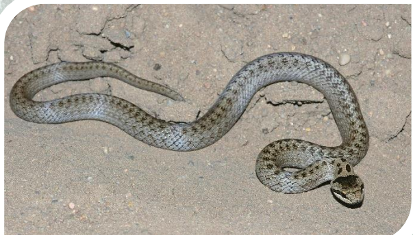
GNIEWOSZ PLAMISTY – Gatunek chroniony