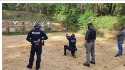
zdjęcie grupowe uczestników wyjazdu_4