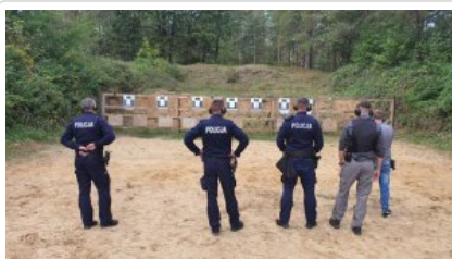
zdjęcie grupowe uczestników wyjazdu_5