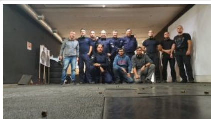
zdjęcie grupowe uczestników wyjazdu_1

Zespół Funduszy Pomocowych KWP zs. w Radomiu