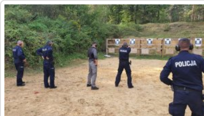
zdjęcie grupowe uczestników wyjazdu_3