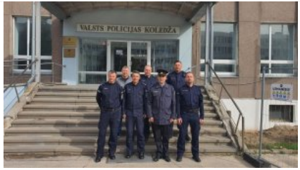
zdjęcie grupowe uczestników wyjazdu_7