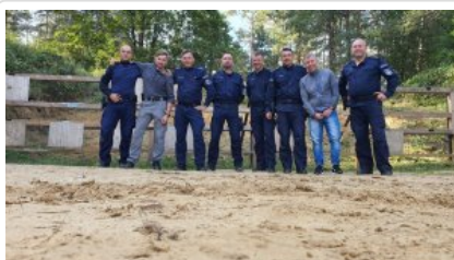
zdjęcie grupowe uczestników wyjazdu_2