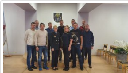
zdjęcie grupowe uczestników wyjazdu_6