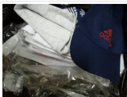
Towar z podrobionym znakiem towarowym