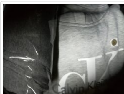
Towar z podrobionym znakiem towarowym