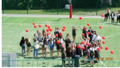
"Wypuszczenie czerwonych balonów" jako znak przeciwko przemocy