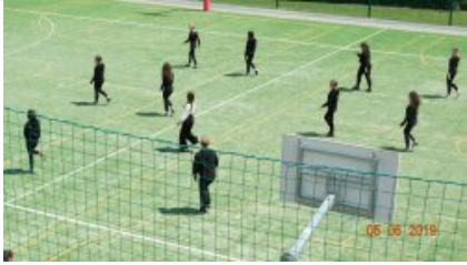
Część artystyczna podczas "Dnia bez przemocy"