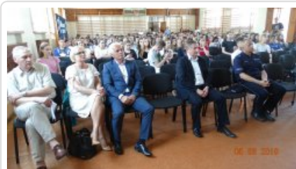
Zaproszeni goście i uczniowie na "Dniu bez przemocy"