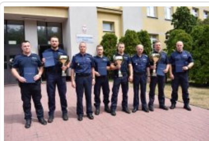
laureaci turnieju par patrolowych