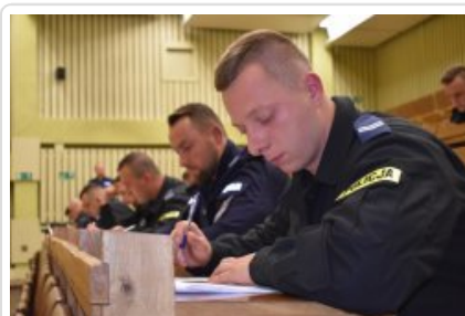
turniej par patrolowych