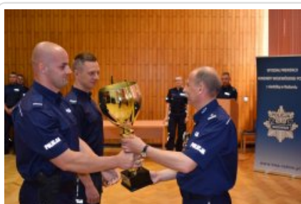
Najlepszy patrol w garnizonie