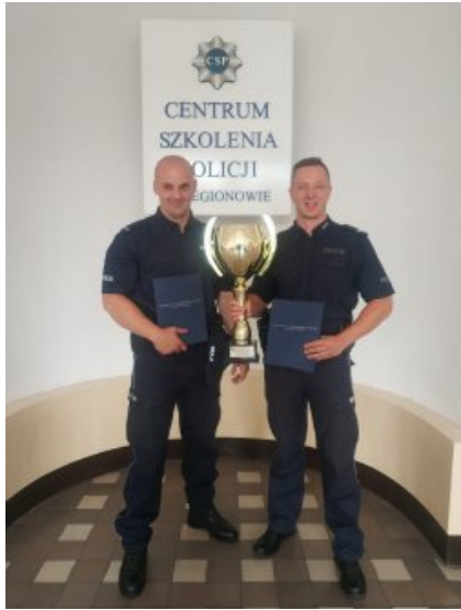
laureaci wojewódzkich eliminacji zawodów