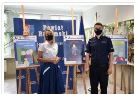
policjant z KMP w Radomiu i Powiatowy Rzecznik Konsumenta

W ramach II edycji projektu pn. "Aktywny i świadomy Senior w świecie finansów" policjanci z Komendy Miejskiej Policji w Radomiu współpracują z Powiatowym Rzecznikiem Konsumentów. W budynku Starostwa Powiatowego w Radomiu można oglądać wystawę edukacyjną prac plastycznych.