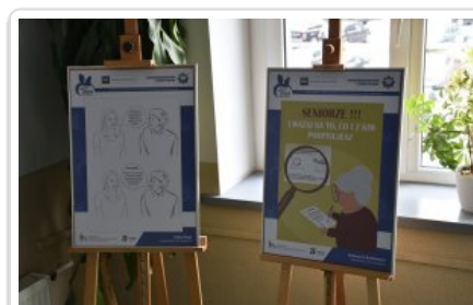
wystawa edukacyjna prac plastycznych