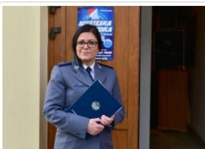
7. finał akcji charytatywnej "Niebieska Gwiazdka". Fot. K. Sałasińska