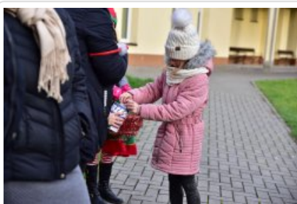
7. finał akcji charytatywnej "Niebieska Gwiazdka".