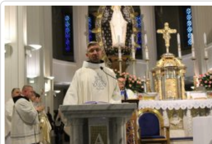
7. finał akcji charytatywnej "Niebieska Gwiazdka".