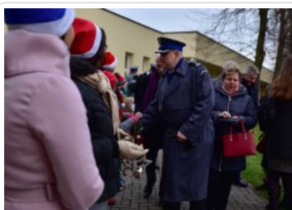
7. finał akcji charytatywnej "Niebieska Gwiazdka".