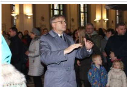
7. finał akcji charytatywnej "Niebieska Gwiazdka".