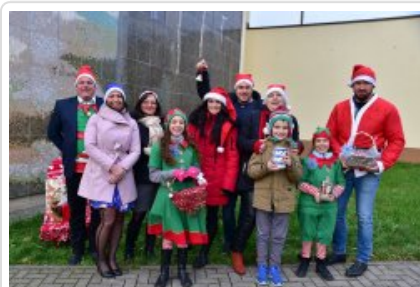
7. finał akcji charytatywnej "Niebieska Gwiazdka".