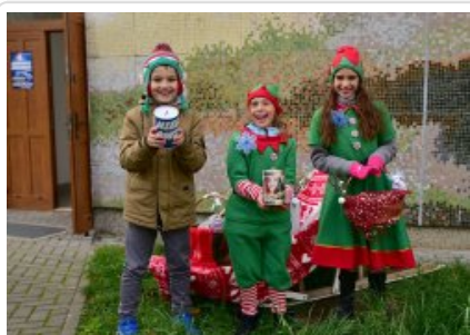
7. finał akcji charytatywnej "Niebieska Gwiazdka".