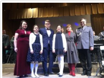
7. finał akcji charytatywnej "Niebieska Gwiazdka".