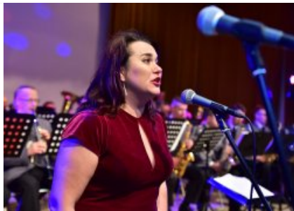
7. finał akcji charytatywnej "Niebieska Gwiazdka".