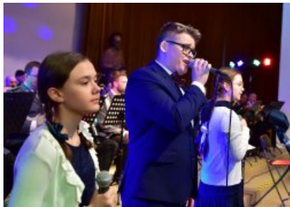
7. finał akcji charytatywnej "Niebieska Gwiazdka".