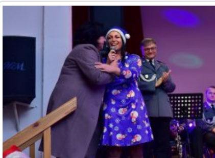
7. finał akcji charytatywnej "Niebieska Gwiazdka".