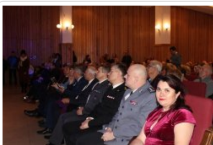
7. finał akcji charytatywnej "Niebieska Gwiazdka".