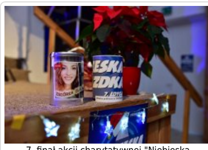
7. finał akcji charytatywnej "Niebieska Gwiazdka".