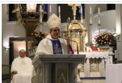
7. finał akcji charytatywnej "Niebieska Gwiazdka".