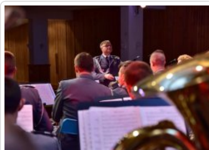
7. finał akcji charytatywnej "Niebieska Gwiazdka". Fot. K. Sałasińska