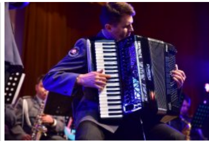
7. finał akcji charytatywnej "Niebieska Gwiazdka".