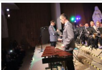
7. finał akcji charytatywnej "Niebieska Gwiazdka".