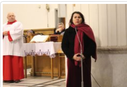
7. finał akcji charytatywnej "Niebieska Gwiazdka".