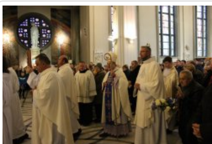
7. finał akcji charytatywnej "Niebieska Gwiazdka".