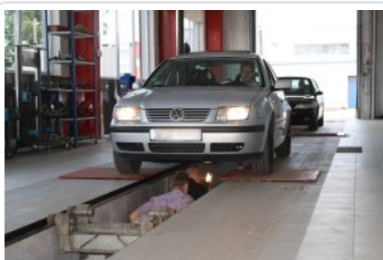
"Przed wyjazdem na wakacje sprawdź swój samochód i oznakuj rower"

Ponad 30 kierowców wzięło udział w bezpłatnych kontrolach stanu technicznego samochodów, jakie w niedzielę 18 czerwca 2017 roku zorganizowała dla mieszkańców Okręgowa Stacja Kontroli Pojazdów „Skrawmet” w Sierpcu wspólnie z Komendą Powiatową Policji w Sierpcu. Działania miały na celu wykrycie wadliwie działających układów pojazdu wpływających na bezpieczeństwo podróżujących, a tym samym podlegających naprawie lub wymianie. Przeprowadzone wspólne działania stanowiły jednocześnie przygotowanie pojazdów do bezpiecznych wyjazdów na wakacje.