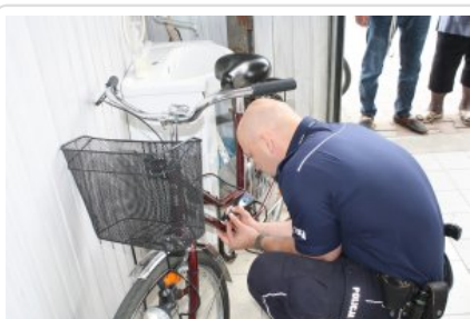
"Przed wyjazdem na wakacje sprawdź swój samochód i oznakuj rower"