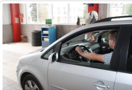
"Przed wyjazdem na wakacje sprawdź swój samochód i oznakuj rower"