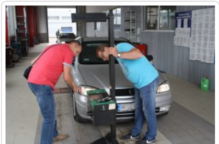
"Przed wyjazdem na wakacje sprawdź swój samochód i oznakuj rower"