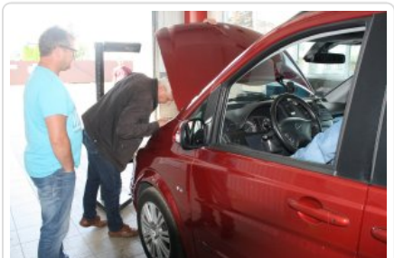
"Przed wyjazdem na wakacje sprawdź swój samochód i oznakuj rower"