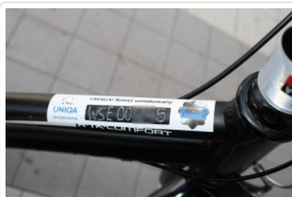
"Przed wyjazdem na wakacje sprawdź swój samochód i oznakuj rower"