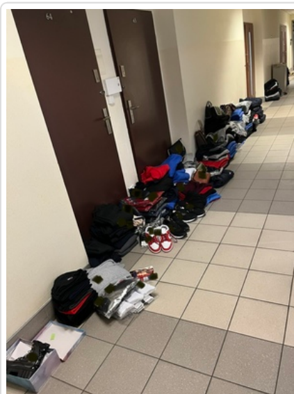
Policjanci zabezpieczyli podrabianą odzież

Policjanci z Wydziału dw. z Korupcją i Przeszecznością Gospodarczą zatrzymali dwóch mężczyzn oraz kobietę, którzy sprzedawali na siedleckim targowisku ubrania i inne przedmioty z podrobionymi znakami towarowymi znanych światowych producentów.