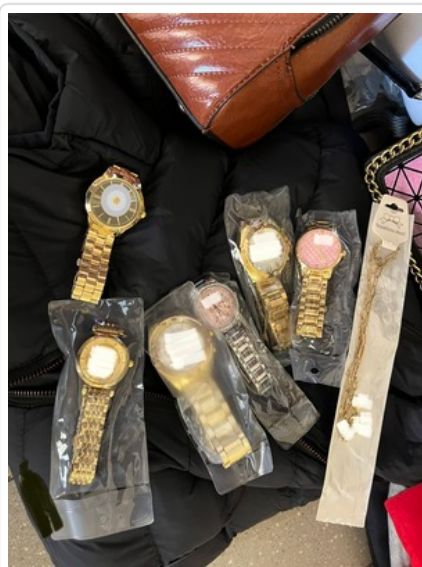
Policjanci zabezpieczyli podrabianą odzież