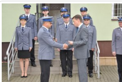
Posterunek Policji w Korytnicy