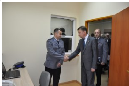
Posterunek Policji w Korytnicy