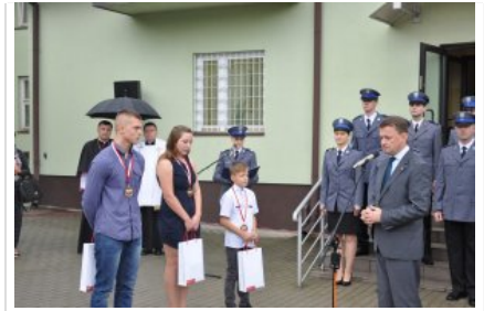
Posterunek Policji w Korytnicy