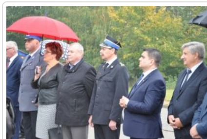
Posterunek Policji w Korytnicy