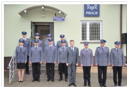
Posterunek Policji w Korytnicy