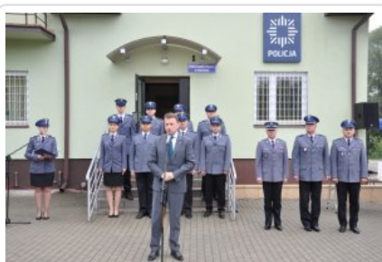
W powiecie węgrowskim przywrócono Posterunek Policji w Korytnicy