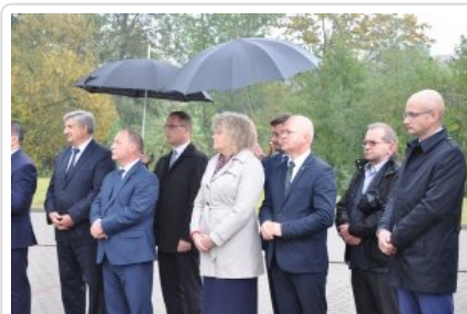
Posterunek Policji w Korytnicy