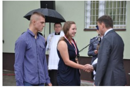
Posterunek Policji w Korytnicy