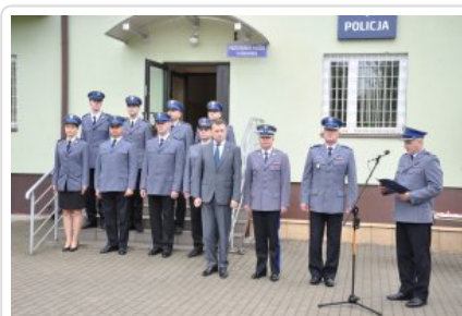
Posterunek Policji w Korytnicy