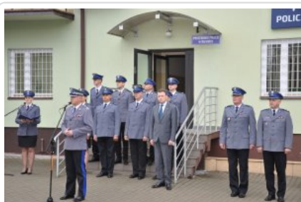
Posterunek Policji w Korytnicy