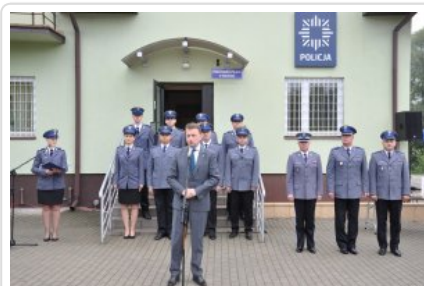
Posterunek Policji w Korytnicy