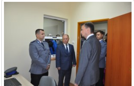
Posterunek Policji w Korytnicy

Wśród gości nie mogło zabraknąć Wicemarszałek Senatu RP Marii Koc oraz Posła na Sejm RP Grzegorza Woźniaka, duchowieństwa, przedstawicieli władz samorządowych i instytucji na co dzień współdziałających z policjantami na rzecz bezpieczeństwa w regionie.