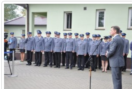
Posterunek Policji w Korytnicy