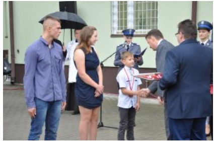
Posterunek Policji w Korytnicy