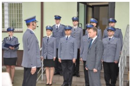
Posterunek Policji w Korytnicy